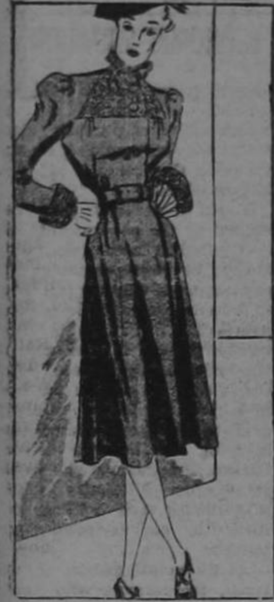
Gray in fashion picture.