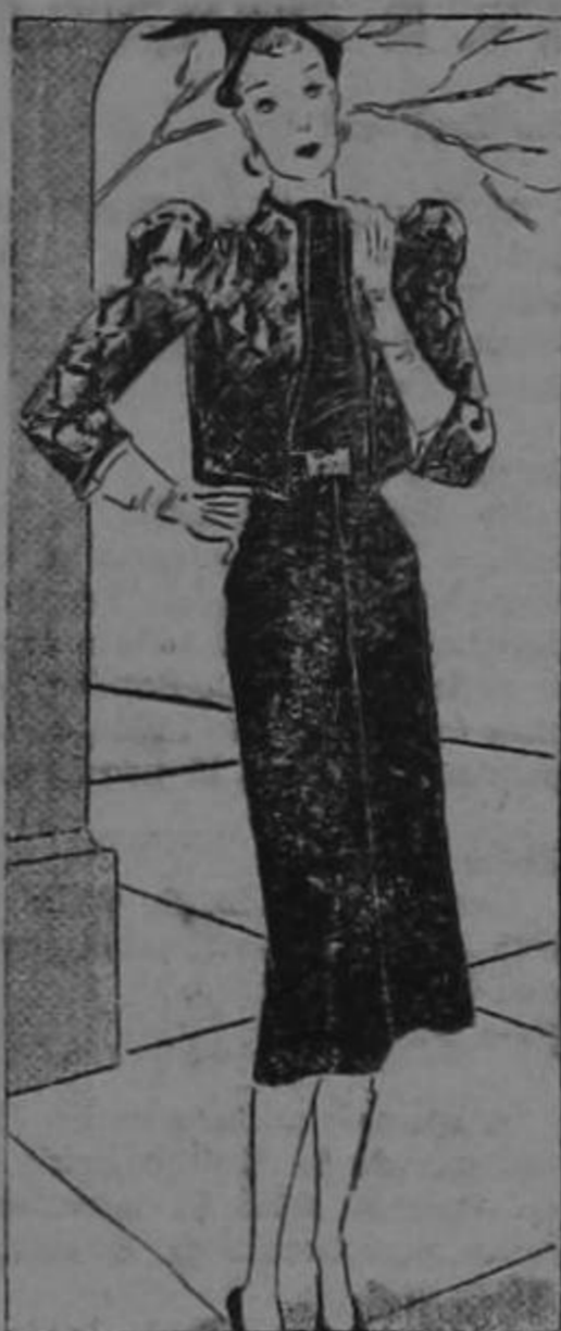
For early spring wear By VERA WINSTON

Gloves have become an integral part of the costume and some fashionables invariably buy a pair of gloves for every outfit. Paris designs marvelous gloves and sketched here are three models for early spring.